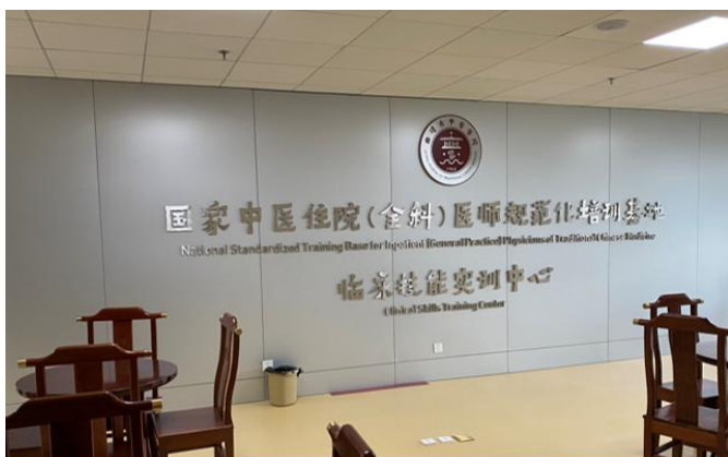
临床技能实训中心