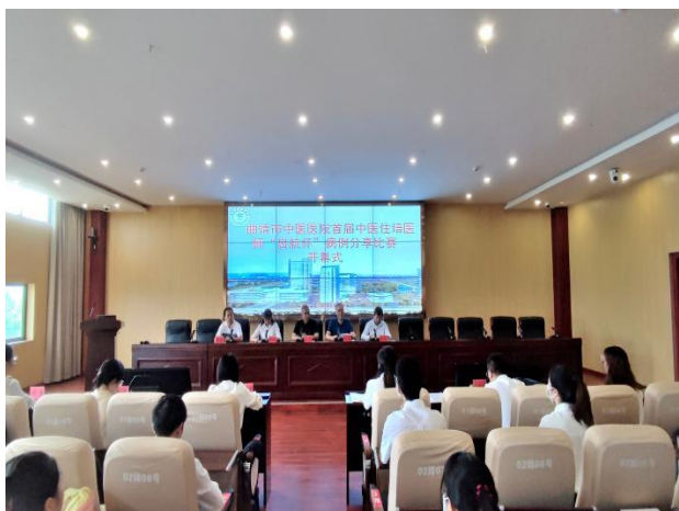
病例分享比赛开幕式