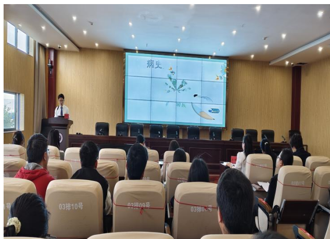
学员病例分享比赛