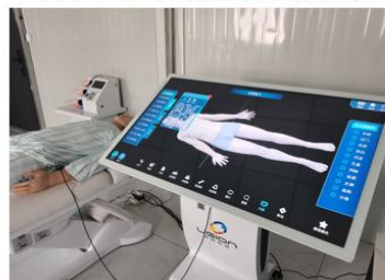
中医全身智能针灸模拟人系统