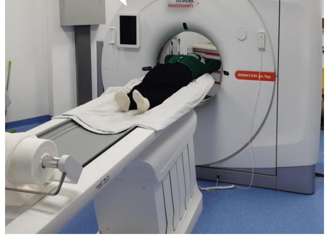
64 排西门子 CT