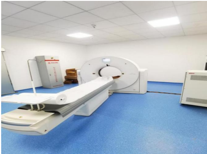
40 排联影 CT