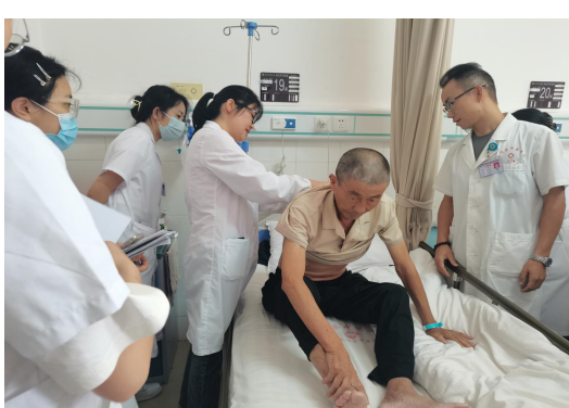
临床带教教学查房