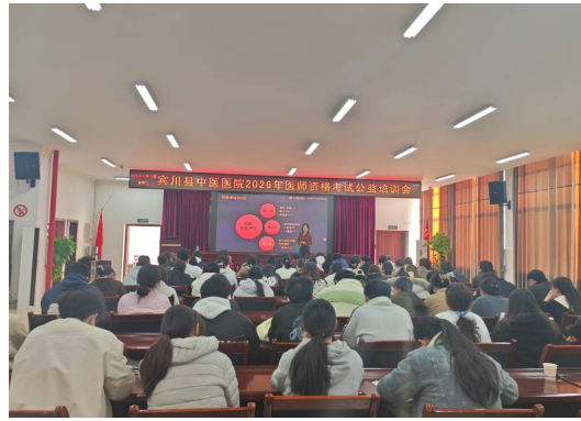
医师资格考试培训