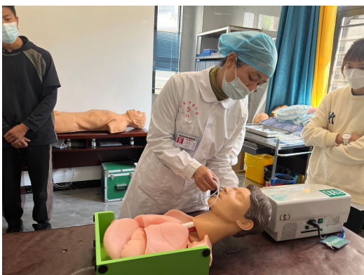
洗胃机械使用教学