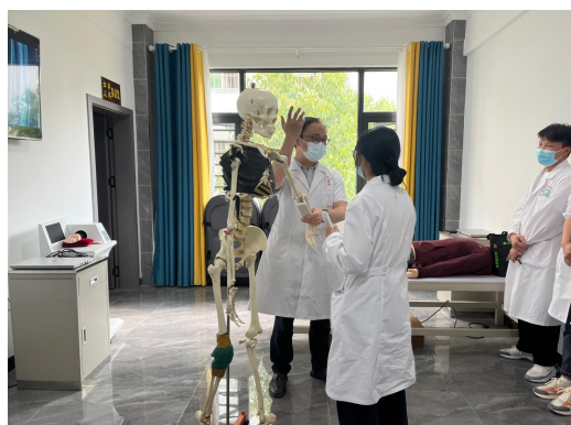
脊柱四肢骨折教学