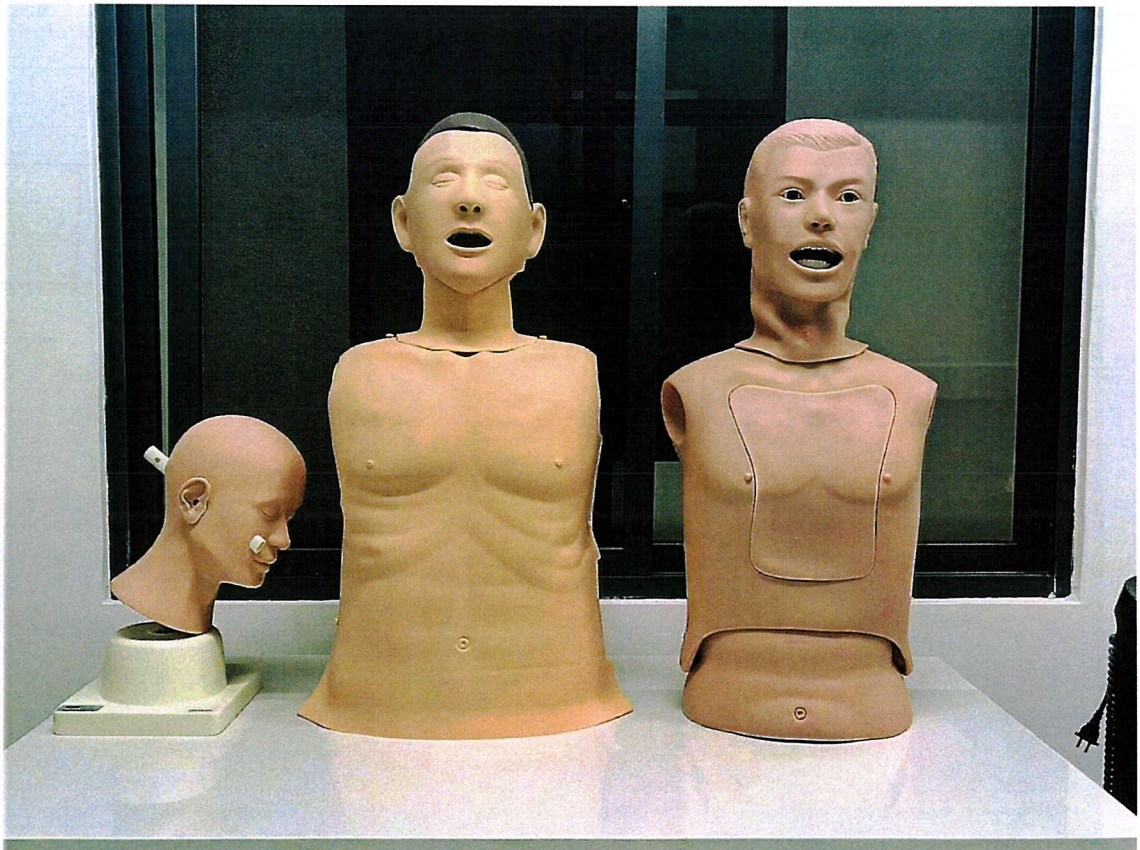
医院临床技能中心