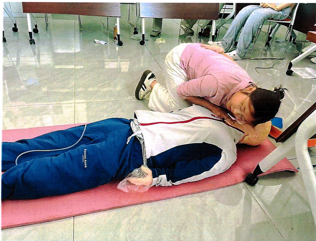
医师资格考试和结业考试考前培训