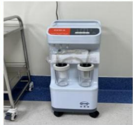
(临床技能培训中心部分设备、模具)